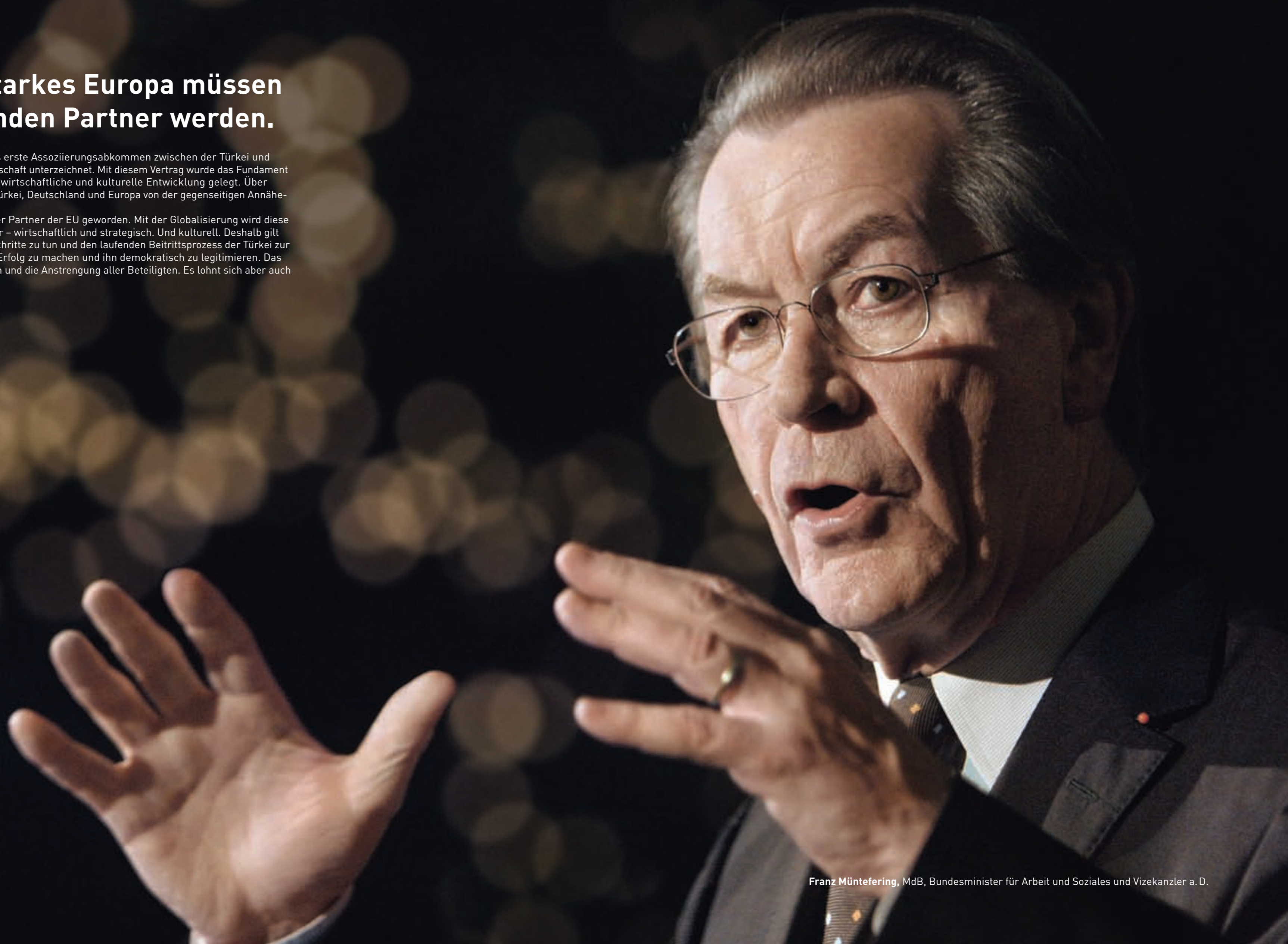
Franz Müntefering, MdB, Bundesminister für Arbeit und Soziales und Vizekanzler a. D.

Die Türkei ist verlässlicher Partner der EU geworden. Mit der Globalisierung wird diese Verbindung noch wichtiger – wirtschaftlich und strategisch. Und kulturell. Deshalb gilt es, konsequent weitere Schritte zu tun und den laufenden Beitrittsprozess der Türkei zur EU zu einem politischen Erfolg zu machen und ihn demokratisch zu legitimieren. Das erfordert den guten Willen und die Anstrengung aller Beteiligten. Es lohnt sich aber auch für alle Beteiligten.